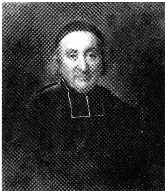
Figure 2. Antoine Plamondon (d'après Paulin Guérin), L'abbé Louis-Philippe Desjardins , 1828-30, huile sur toile, 72.3 x 60.3 cm, Musée des Augustines de l'Hôtel-Dieu de Québec.

Tout leur intérêt artistique réside dans une sorte de réalisme paysan, naïvement sincère, plein de familiarité et de bonhomie; réalisme d'artisan jovial et sans façon, tout d'une pièce, mais avec des finesses à peine murmurées, des sourires narquois, des sous-entendus spirituels, de bonnes grosses histoires débitées à demi-mots, un sentiment humain d'une chaleureuse cordialité; réalisme de la vision et réalisme du pinceau, avec juste ce qu'il faut d'artificielle et de tenue pour ne pas tomber dans le vulgaire, avec juste ce qu'il faut de vivacité, de naturalisme et de couleur locale pour se distinguer d'une certaine peinture fade et ennuyeuse.