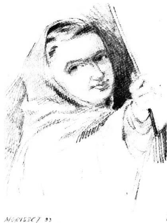
Figure 5. Gérard Morisset, d'après Claude François (dit frère Luc), détail de l'Ex-voto à Notre-Dame de Foy, 1932-33.

tieux, bienveillant et discret : visage massif, hautement coloré, empreint d'une goguenardise paysanne; nez long, épaté, fureteur; lèvres fortement ourlées et gourmandes; grands yeux sombres et vifs. Mélange de traits populaires et de raffinement provincial; sérénité d'un esprit que n'altèrent point les préoccupations de l'existence quotidienne; joie de vivre; ardeur au travail prestement exécuté; c'est avec ces qualités que le Récollet a peint, parmi des œuvres simplement honorables, des morceaux d'une émouvante éloquence et d'une tenue digne des maîtres du XVII e siècle 36 .