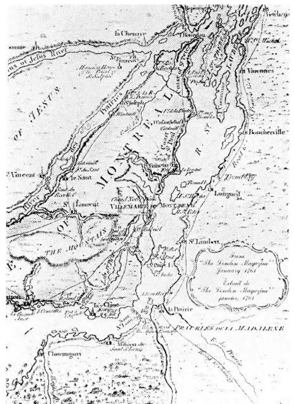
FIGURE 2. «The Isles of Montreal as they have been Survey'd», 1761 (De Volpi et Winkworth, Montréal , pages de garde).