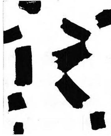
FIGURE 3. Paul-Émile Borduas, 3 + 3 + 4, 1956. Montréal, Musée d'art contemporain.