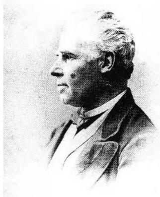
FIGURE 3. William Notman Studio, Sir George-Etienne Cartier , 1871. Albumen print, 14 × 10 cm.