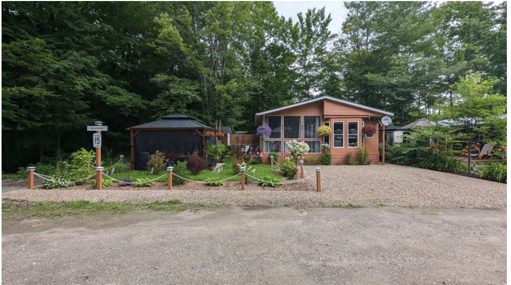
/fig. 12/ Camping Domaine la Fierté, lot 72, rue de l'Aigle-Royal.