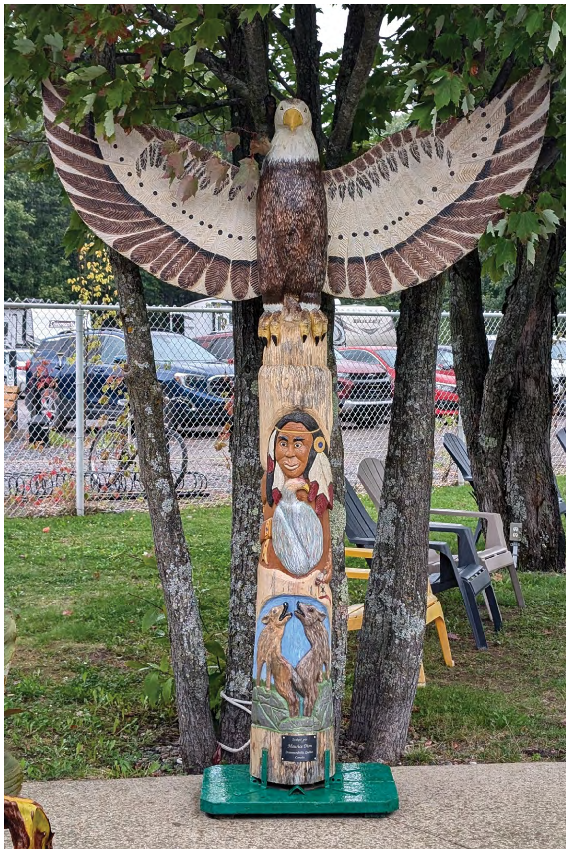
/fig. 14/ Maurice Dion, Totem , 2017, photographie de l'auteur.