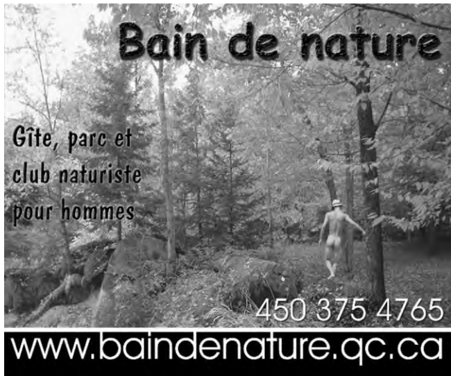
/fig. 5/ Publicité du gîte Bain de nature, magazine Fugues , juillet 2011, p. 81.