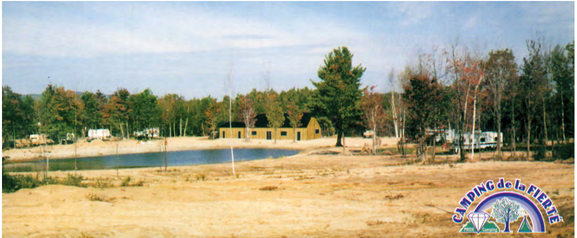
/fig. 1/ Dépliant du camping Domaine la Fierté, vers 1998, 9,2 × 21,6 cm.