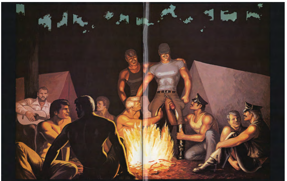
/fig. 8/ Tom of Finland, Camping , 1990, livret imprimé, pages 28-29, 43,2 × 27,9 cm.