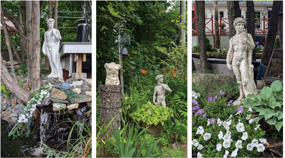
/fig. 7/ Quelques-unes des répliques du David de Michel-Ange au camping Domaine la Fierté, photographies de l'auteur.