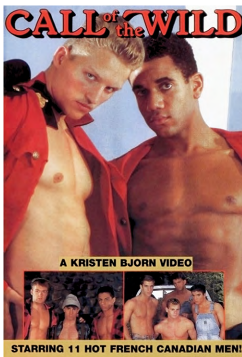
/fig. 10 / Couverture du DVD de Call of the Wild (1990). Courtoisie de l'artiste.