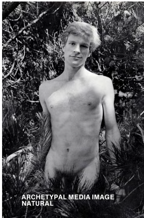
/fig. 6/ Hal Fischer, Archetypal Media Image: Natural , de la série Gay Semiotics , 1977, photographie argentique, 47 × 31,4 cm.