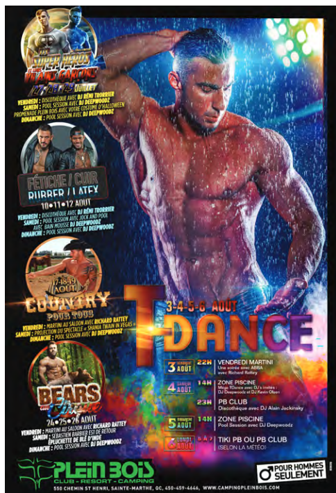
/fig. 9 / Publicité du camping Plein Bois, magazine Fugues , août 2018, p. 169.