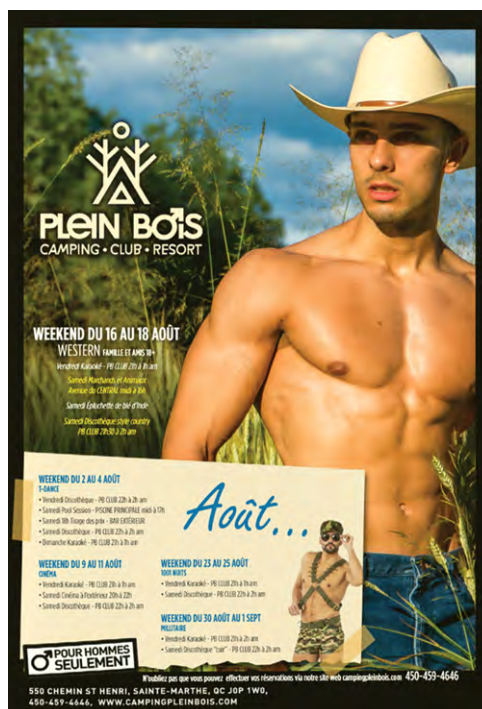
/fig. 3/ Publicité du camping Plein Bois, magazine Fugues , août 2024, p. 163.