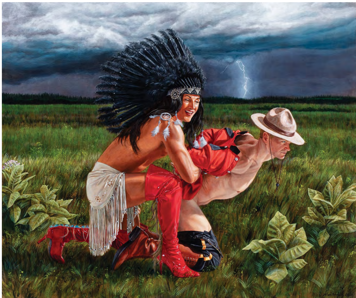
/fig. 11/ Kent Monkman, Unseeded Territory , 2020, acrylique sur toile, 76,2 × 91,4 cm, collection de l'artiste.